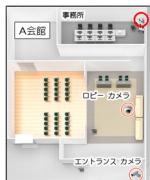
A会館 本部事務所パソコン